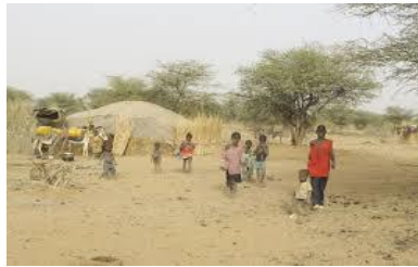
Campement d'éleveur Peulh