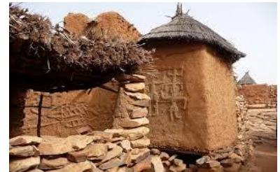
Campement d'agriculteur dogon

Ainsi donc le foncier Agricole est marqué par la grande diversité des zones agro écologiques, par la cohabitation entre différents groupes ethniques et par la coexistence d'une variété d'activités productives rurales. Cette situation est à l'origine de conflits de divers ordres, d'abord, au sein du même système de production, ensuite, entre différents systèmes de production. Un contexte institutionnel adéquat aurait pu permettre une gestion efficace de ces conflits et favoriser la mise en œuvre de mesures propices au décollage Agricole ; mais ce n'est pas le cas. Le contexte institutionnel de la gestion du foncier rural est marqué par l'existence d'un pluralisme juridique que les autorités ont beaucoup de difficultés à gérer de façon efficace.