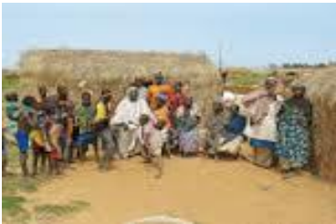
Campement de pêcheur Bozo

Dans la zone saharienne, les terres sont exploitées par les populations à tradition nomade : maures, tamasheks, arabes. Elles sont détenues par les grandes familles et clans. Le système de production pastoral fait qu'il existe de fortes compétitions pour l'accès aux terres de pâture et culture notamment les mares, les points d'eau.