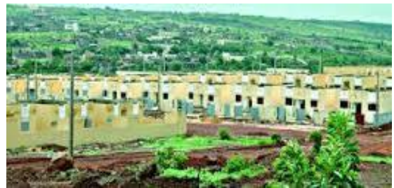
Vente de terres aux alentours de Bamako

La ruée vers les terres périurbaines est le fait, essentiellement, de l'élite citadine (commerçants, fonctionnaires, cadres des professions libérales) qui investit dans le foncier, soit pour constituer des fermes modernes, soit à des fins de spéculation foncière.